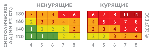
ОБЩИЙ ХОЛЕСТЕРИН ШКАЛА ОТНОСИТЕЛЬНОГО РИСКА

Для людей моложе 40 лет рекомендуется пользоваться Шкалой относительного риска . Шкала используется безотносительно пола и возраста человека и учитывает три фактора: систолическое (верхнее) артериальное давление, уровень общего холестерина и факт курения . Технология ее использования аналогична таковой для основной Шкалы SCORE.